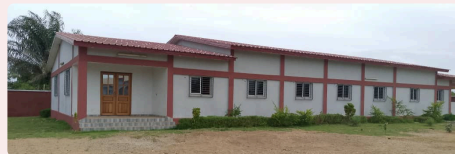
Un dortoir adapté

Initialement, nous avions prévu la construction d'un dortoir à étage pouvant accueillir 64 élèves. Cependant, la hausse importante du coût des matériaux nous a amenés à revoir nos ambitions à la baisse. C'est ainsi qu'un dortoir plus simple de 40 places a été réalisé dans un premier temps.